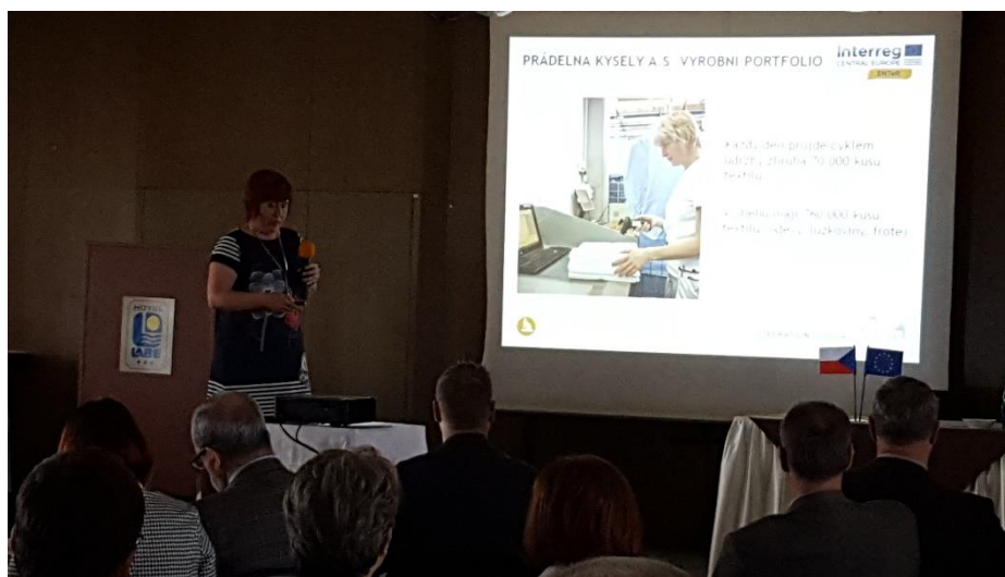
Prezentace na konferenci TEX – CHEM v Pardubicích

Spolupráce na tomto projektu přinesla SOTEXu možnost provázat sektor textilní výroby se sektorem údržby. Byla zpracována studie s tématem vzniku a nakládáním s textilním odpadem z průmyslových prádeln. Výsledky byly prezentovány na TEXCHEM – konferenci textilních chemiků a koloristů v Pardubicích.