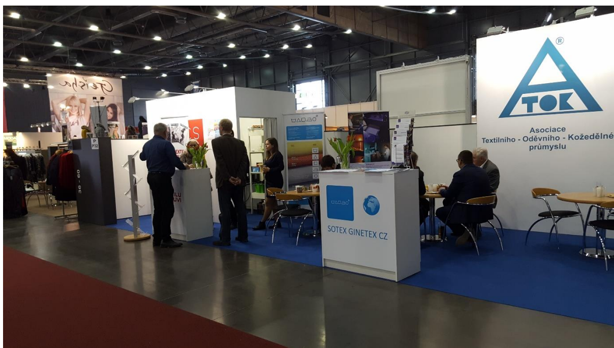
Expozice na veletrhu Styl/KABO únor 2019

Mimo prezentaci na veletrzích jsou aktivně oslovovány firmy ve spolupráci s Textilním zkušebním ústavem. Jedná se o organizace, které mají povinnost výrobky přezkoušet (zejména výrobky pro děti do 3 let věku). Značka QZ – zaručená kvalita jim pak umožní zviditelnit investované prostředky a tím informovat spotřebitele o kvalitě svého výrobku.