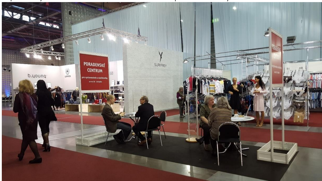
Poradenské centrum, které bylo zajištěno ve spolupráci s Textilním zkušebním ústavem.

Prezentace značky QZ – zaručená kvalita byla v roce 2019 opět zaměřena na přímé oslovení na odborných veletrzích Styl, které se konají jako kontraktační vždy ve druhé polovině měsíců únor a srpen. Na stánku byla k dispozici sada informačních materiálů včetně reklamního poutače. Součástí únorové expozice bylo také oblíbené informační centrum pro návštěvníky veletrhu.