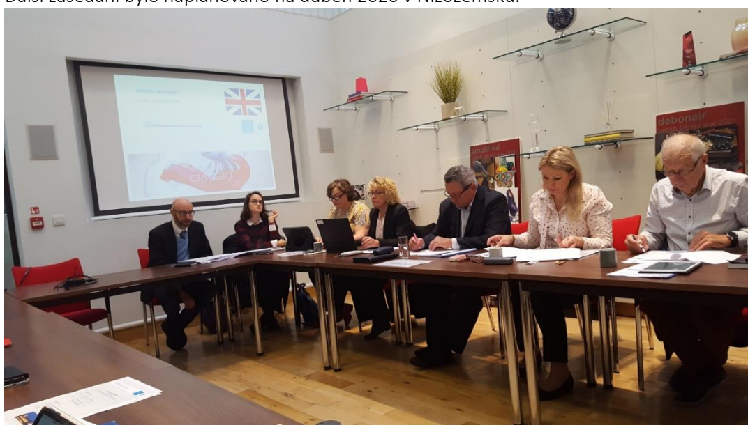
Valná hromada GINETEXu 2019

Další zasedání bylo naplánováno na duben 2020 v Nizozemsku.