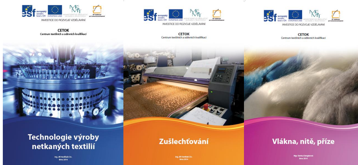
Vzhled vybraných publikací, které vznikly v rámci projektu CETOK

V rámci projektu CETOK, který byl financován ze stejného zdroje, jako Vzdělávání pro prádelny a čistírny, byly nastartovány hlavní aktivity v průběhu roku 2014. Vznikla tedy řada 10 odborných publikací, které pak byly následně ověřeny na pilotních školeních a v posledních měsících roku 2014 byly vytištěny. Úkoly SOTEXu byly plněny podle plánovaných harmonogramů.